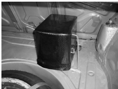
Voorbeeld locatie accuplaats.

Het verplaatsen van de accu is toegestaan mits deze in het achtercompartiment (gedeelte van de auto welke alleen te bereiken is via de achterklep) van de auto blijft en de bevestiging voldoet aan de specificaties zoals vermeld in het Annex-J art. 255.5.8.3.